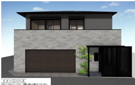
イメージパース ※イメージパースはイメージとして、実際とは異なる場合があります。