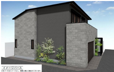
イメージパース ※イメージパースはイメージとして、実際とは異なる場合があります。