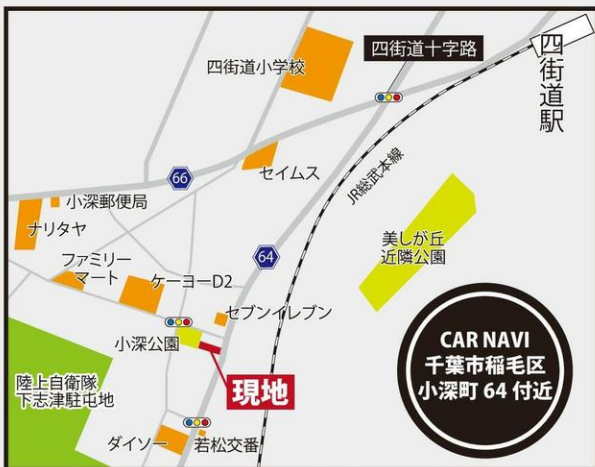
※図面と現況が異なる場合は現況優先とします。