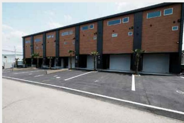
※同等使用建築事例