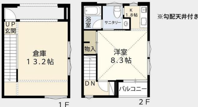
4～9号 間取図 賃料12.5万円