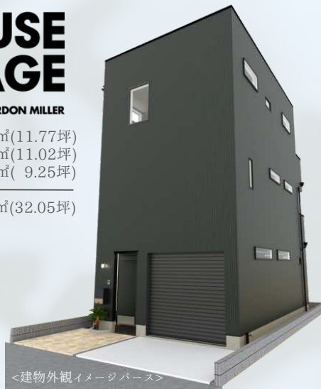
<建物外観イメージパース>